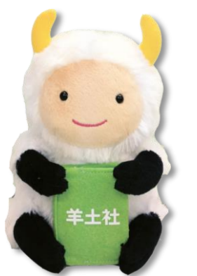
羊土社マスコットキャラクター ひつじ社員

書籍/雑誌の情報は 羊土社ホームページより お探しいただけます。 www.yodosha.co.jp